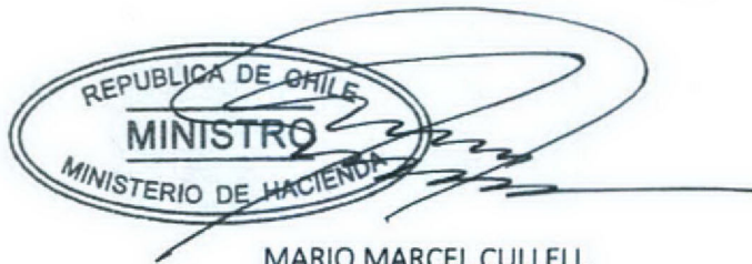
MARIO MARCEL CULLELL MINISTRO DE HACIENDA

"POR ORDEN DEL PRESIDENTE DE LA REPÚBLICA"